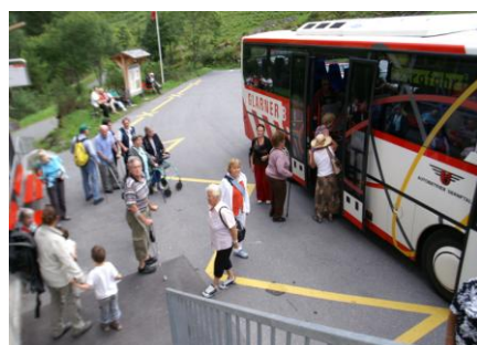
SBB-Bahnhof Schwanden ist mit einem Lift erschlossen mit dem Bus zur Talstation im Kies