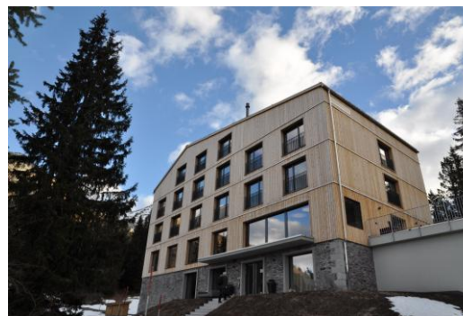
Das neue Berghotel Mettmen AG

Die ganze Route kann mit allen Formen von Geh-Hilfen begangen werden (Rollstühle, Rollatoren, Kinderwagen etc...) Sie ist rollstuhlgängig bis hinten am See.