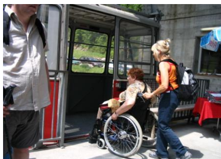
mit der Hebebühne zur Seilbahn nach Mettmen Einstieg in die Seilbahn im Kies (Türbreite 102 cm)